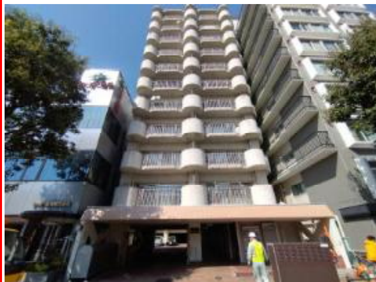
地下鉄南北線 愛宕橋駅 徒歩1分