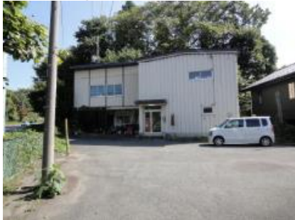
建物①(向って右側の白い建物) ※左の白い建物は建物②