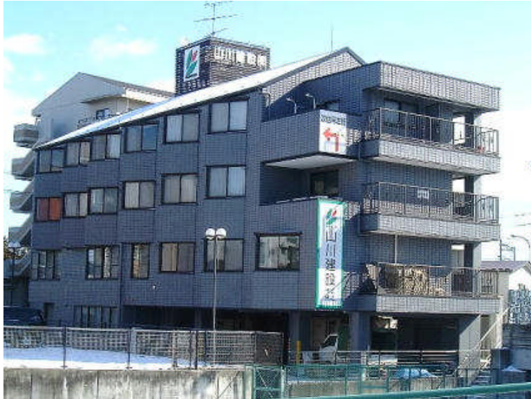
JR仙山線『東照宮駅』徒歩7分