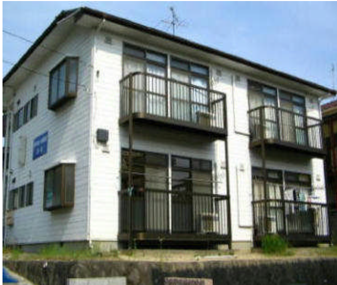
地下鉄南北線『北仙台駅』