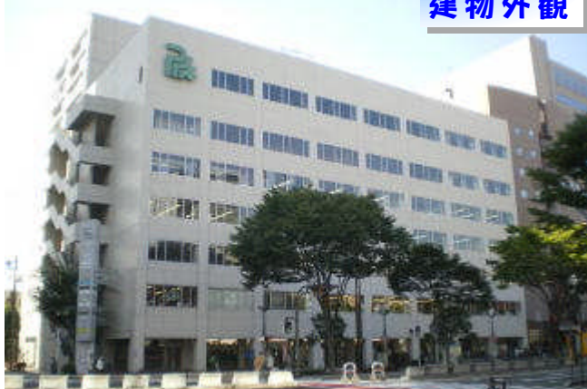
仙台駅東口エリア 1階