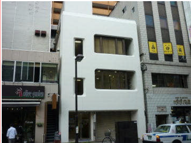
東西線 青葉通一番町駅 徒歩5分