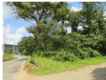
杉等が生育する林地